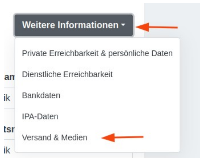
Schaubild 3: Weitere Informationen

Wurden alle Felder ausgefüllt und ausgewählt, muss oben auf der Seite zur Seite „Versand & Medien“ gewechselt werden. Dieser Punkt ist unter „Weitere Informationen“ zu finden.