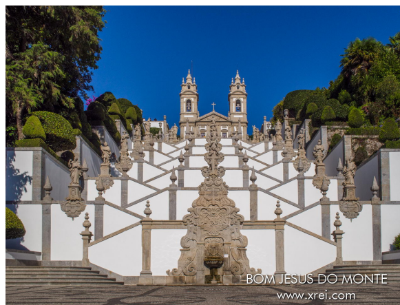
Braga (Bom Jesus do Monte)