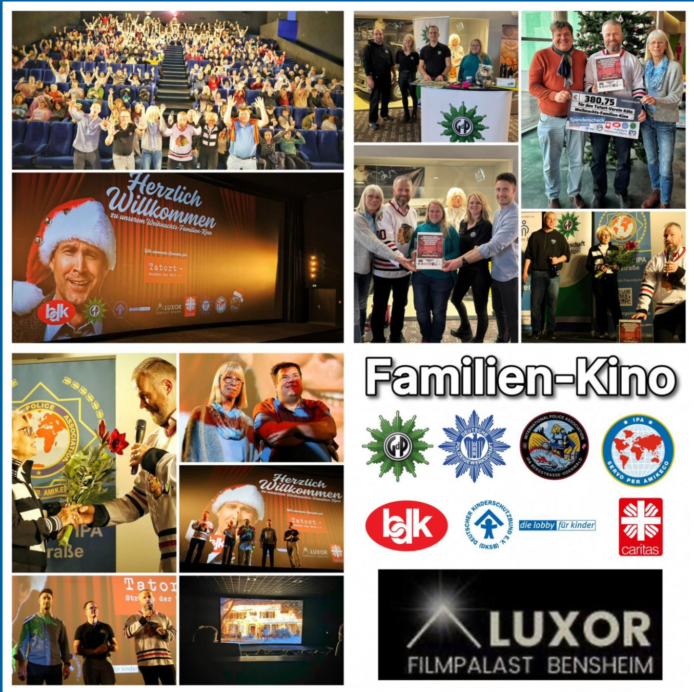
Text: David Weiser

Nach dem Abspann verließen viele Familien das Kino mit guter Laune, lachenden Gesichtern und einer ordentlichen Portion Weihnachtsstimmung. Der volle Kinosaal und die zahlreichen positiven Rückmeldungen machten deutlich: Das Familienkino ist längst mehr als eine Einzelveranstaltung, es ist zur schönen Vorweihnachtstradition geworden. Mit einem augenzwinkernden Blick auf die Familie Griswold wurde deutlich: Selbst, wenn an Weihnachten nicht alles perfekt läuft, bleibt am Ende hoffentlich genug Raum für gemeinsames Lachen.